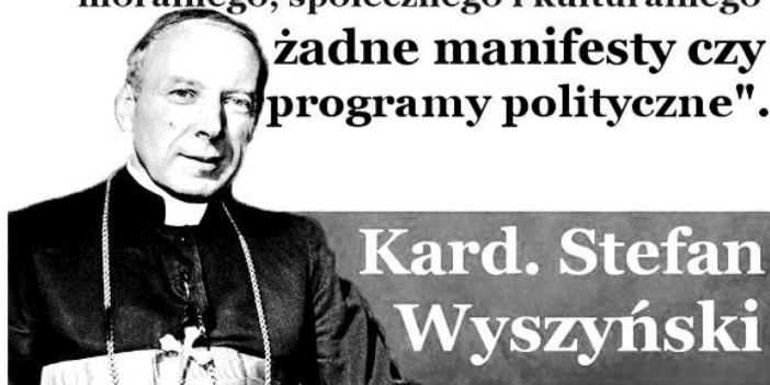
Kard. Stefan Wyszyński

„Jeżeli z dłoni Narodu wypadnie Ewangelia, nie uratują jego poziomu moralnego, społecznego i kulturalnego żadne manifesty czy programy polityczne”.